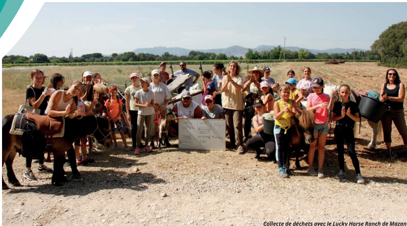
Collecte de déchets avec le Lucky Horse Ranch de Mazan

Le meilleur des déchets est celui que l'on ne produit pas. Pour réduire leur volume et économiser les ressources, la CoVe a mis en place des actions de prévention dont vous êtes partie prenante, particuliers comme professionnels.