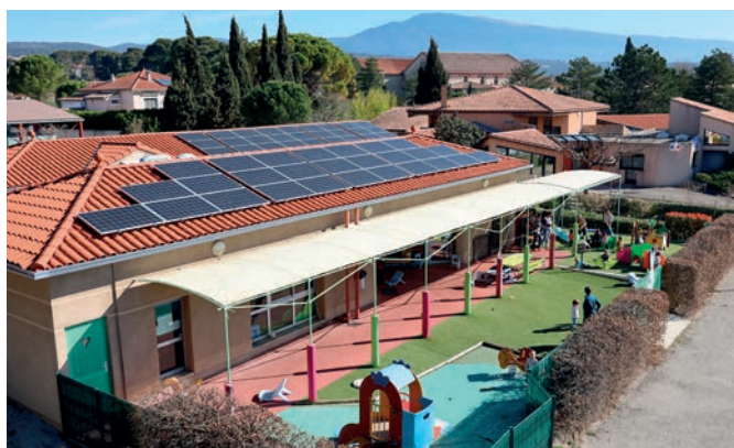
Centrale solaire de la crèche Capucine à Caromb