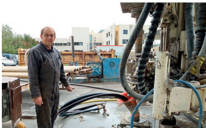
Forage géothermique à l'Hôtel de la CoVe

suivante verra le remplacement de la chaufferie à gaz, une énergie fossile et polluante, par une pompe à chaleur alimentée via la géothermie. L'intérêt de cette solution est d'exploiter une énergie terrestre gratuite pour un gain économique et écologique indéniable.