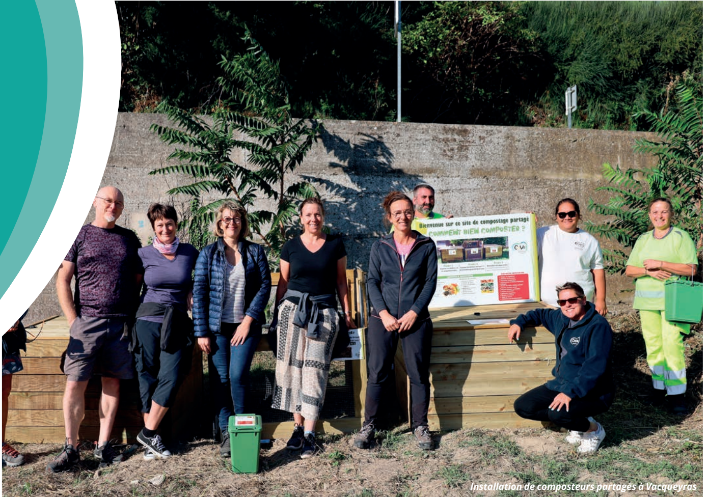
Installation de composteurs partagés à Vacqueyras